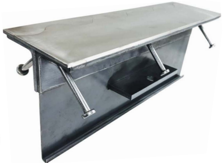
CONJUNTO DE ALMACENAMIENTO FRÍO 06NCE130