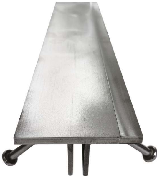
TECHO DE UNIÓN INDUSTRIAL 08NE120

Somos flexibles con los nuevos diseños de juntas y estamos abiertos a realizar modificaciones.