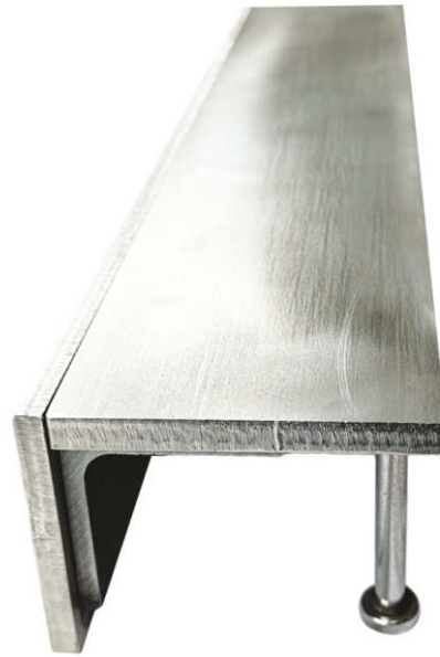
CONEXIÓN ENTRE EL PISO ANTIGUO Y EL NUEVO 10NF108

También ofrecemos una gama de soluciones versátiles diseñadas para satisfacer diversas necesidades y aplicaciones. Entre ellas, se incluyen perfiles no estándar que se pueden preparar según las necesidades del cliente.